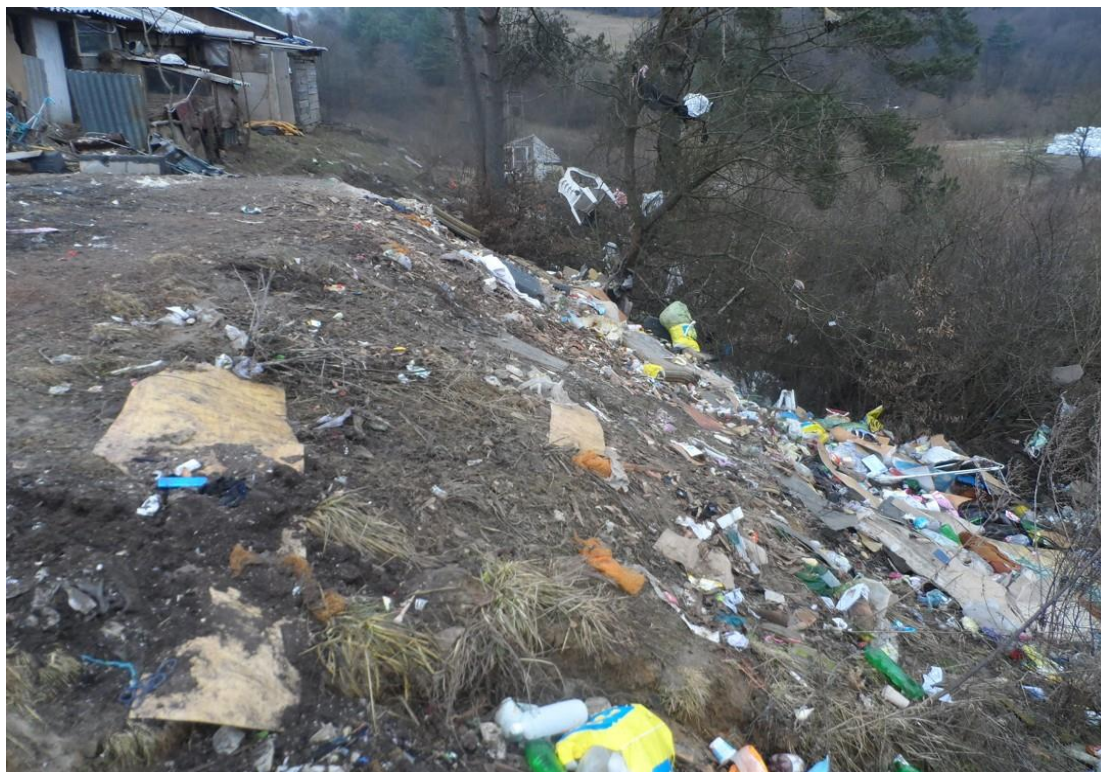
Obr. 1 Nelegálna skládka odpadu na parcele KN-E 1795/1